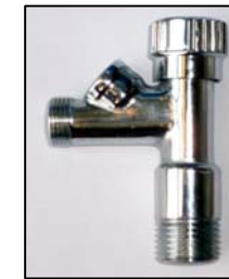
Absperrhahnen zu Pos. D und W

Hinweis: Anordnung frei wählbar, je nach Leitungsführung Hinweis: Keine Leitungsführung unterhalb des Stuhles