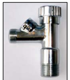
Absperrhahnen zu Pos. D und W

Häubi AG Dentaleinrichtungen, Praxismöblerungen Innenausbau, Innenarchitektur, Badmöbel und Officemöbel