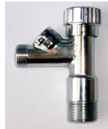
Absperrhahnen zu Pos. D und W