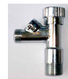
Absperrhahnen zu Pos. D und W