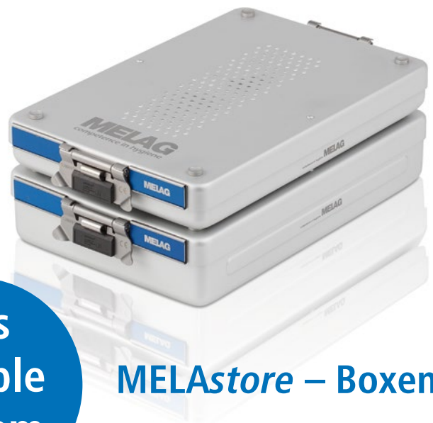
MELAstore – Boxen