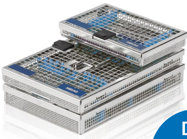
MELAstore – Trays

Durch die sichere Verwahrung der Instrumente im MELAstore-System wird der Schutz für das Praxisteam und für die Instrumente erhöht.